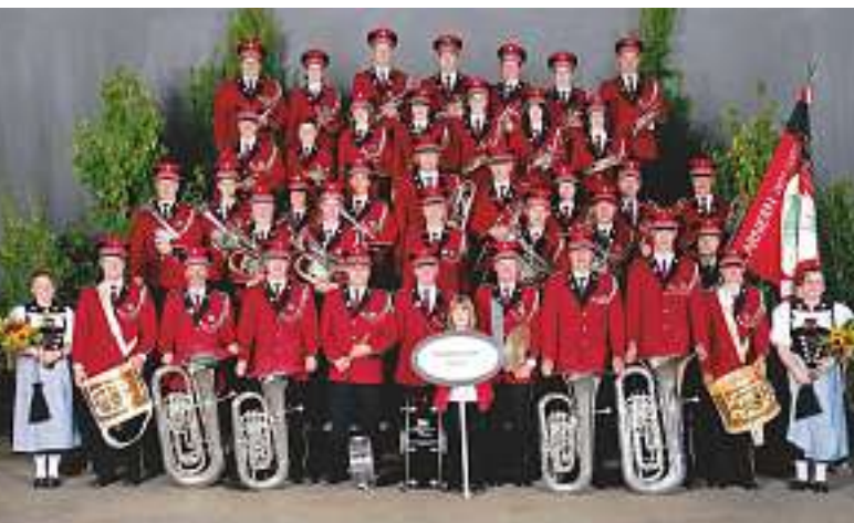
In der Musikgesellschaft Farnern kommt der gesellschaftliche Aspekt nicht zu kurz.